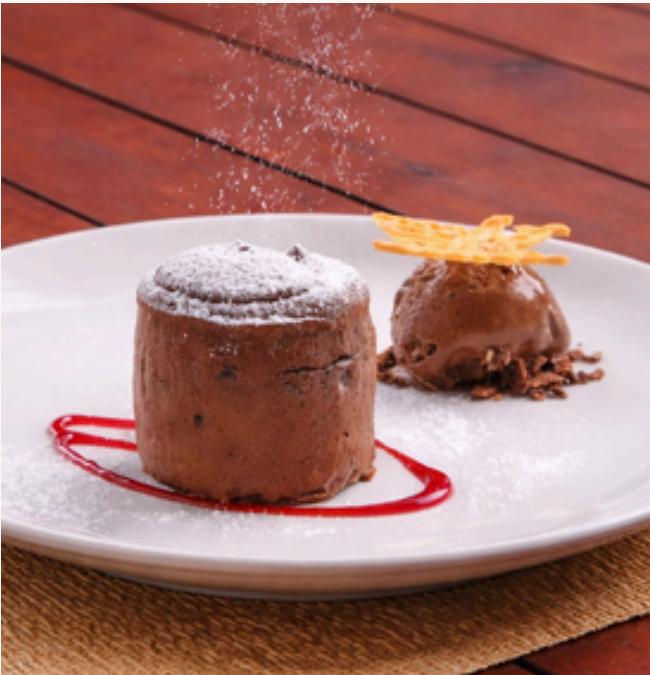
FONDANT AU CHOCOLAT CHOCOLATE FONDANT

Servi avec une boule de glace au chocolat Served with a scoop of chocolate ice cream