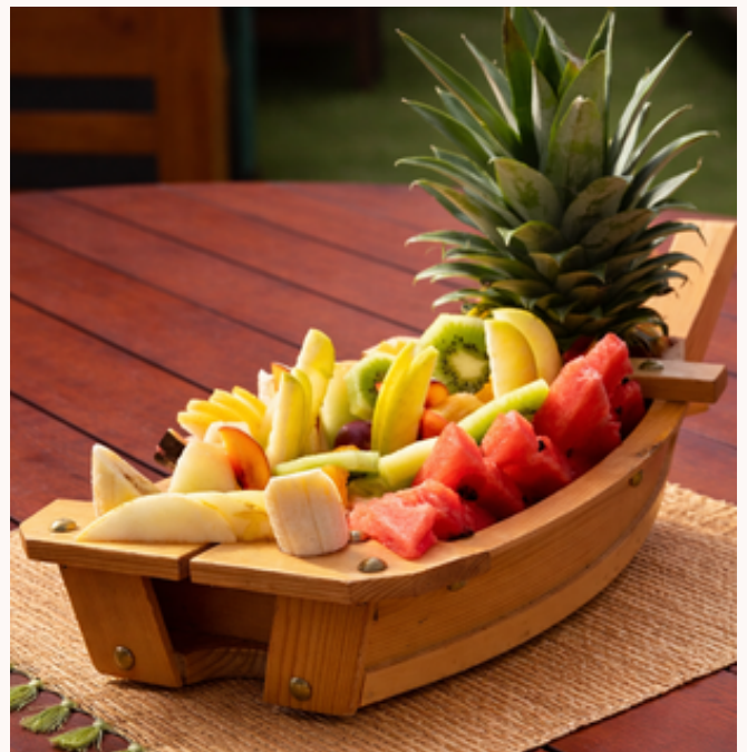
ASSIETTE DE FRUITS DE SAISON SEASONAL FRUIT PLATE