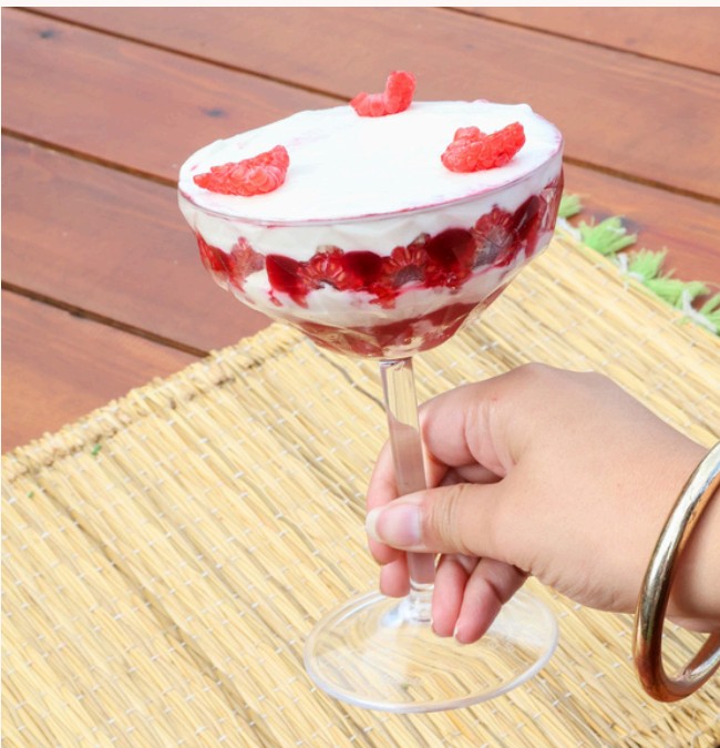
TIRAMISU FRAMBOISE STRAWBERRY TIRAMISU