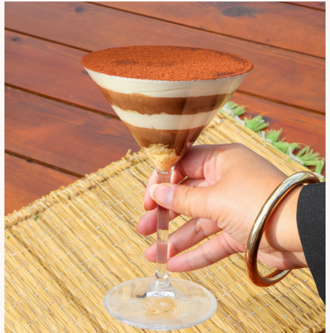
TIRAMISU CHOCOLAT CHOCOLATE TIRAMISU